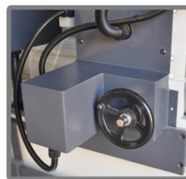
Karbür Bıçaklar İçin Motor Kontrollü Talaş Verme