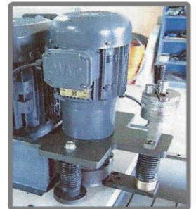
Finish Bileme Kafası