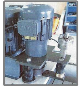
Finish Bileme Kafası