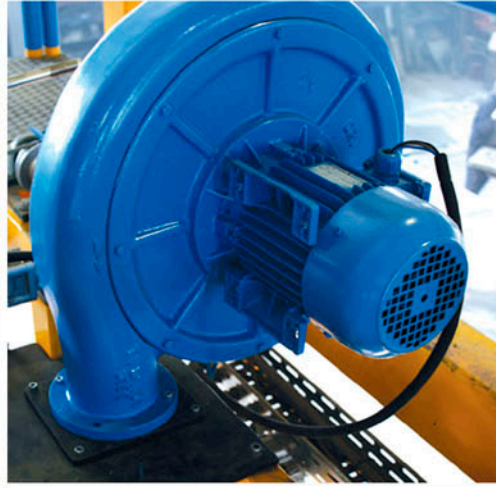
Blower for Better Forming Blower ile Daha İyi Torba Formu