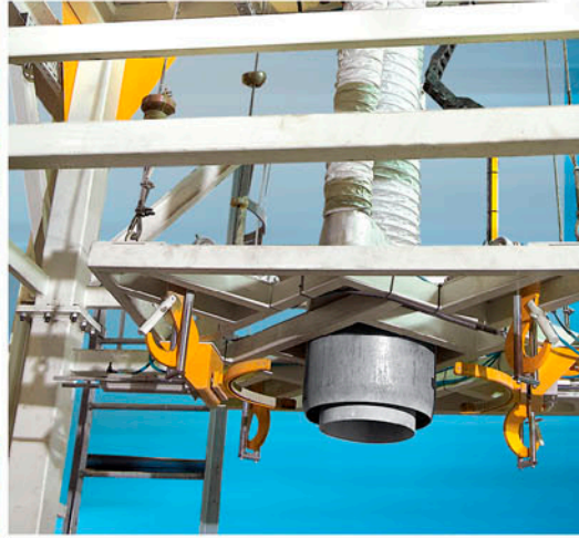
Height Adjustment by Encoder Enkoder ile Yükseklik Ayarı