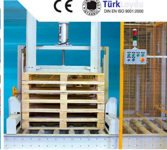
Automatic Pallet Feeding Otomatik Palet Besleme