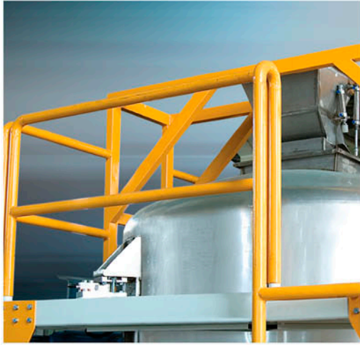
Weighing by Loadcell Ladcell ile Tartım