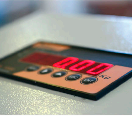
Digital Control and Display Dijital Kontrol ve Ekran